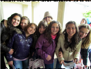
Os professores de História e Ciências Naturais

Os alunos regressaram às aulas e os diferentes espaços foram muito interessantes