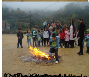
As crianças a dançar Atrás do fogo