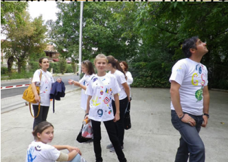
Escrito por: Profs. Graça Pereira e Isabel Carvalho