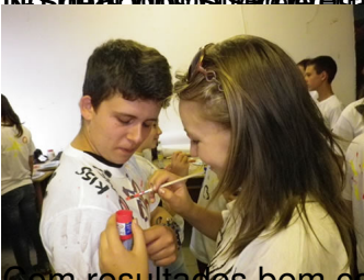
com resultados bem coloridos...