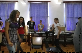
A Banca das Escoras proporcionou um momento bastante divertido.