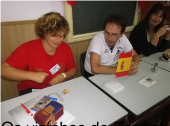
Os vizinhos de turma divertem-se com o jogo do RAPA