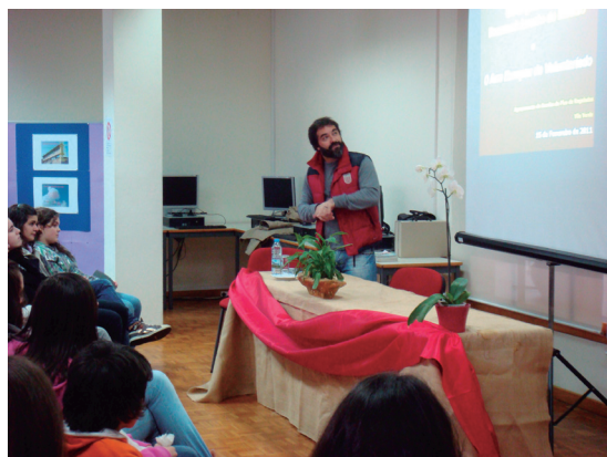
Grupo de EMRC

Desde África, América Latina a países como o Paquistão, o ilustre orador também tem a paixão pela fotografia. Registrou imagens tocantes, sensibilizadoras, que partilhou com todos, captando a atenção dos presentes.