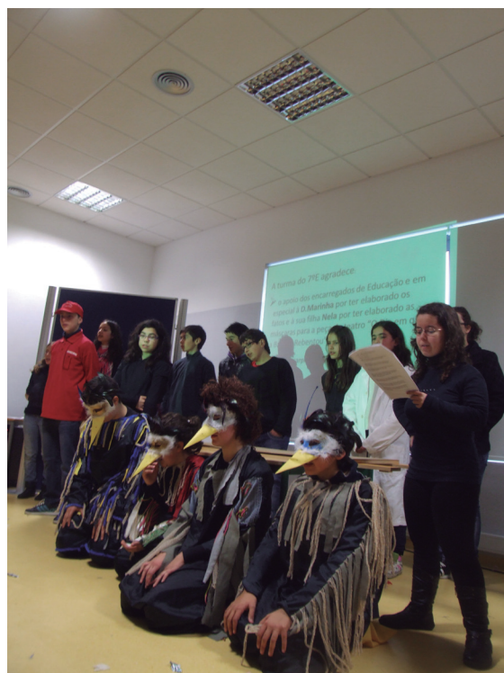
A equipa do Projecto Saúde -100 Riscos

Foi com entusiasmo e dedicação que toda a turma apresentou a sua peça, tendo também uma plateia cheia de olhares atentos e curiosos. A peça foi assim um êxito e todos os seus intervenientes estão de PARABÉNS!