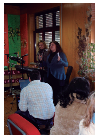
Grupo de EMRC