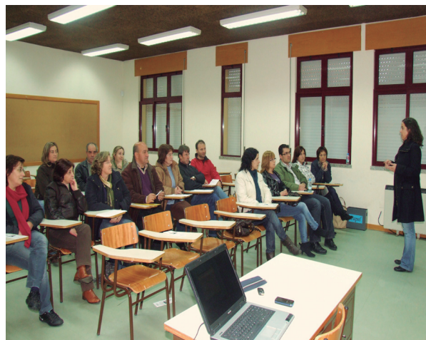
Projecto 100 Riscos

Os principais objectivos desta iniciativa foram a sensibilização, no âmbito de estratégias relacionais com o adolescente, assim como, contribuir para o enriquecimento profissional e pessoal dos participantes.