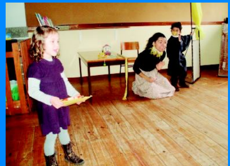
O melro ouviu uma voz melodiosa e descobriu uma pomba presa na gaiola.