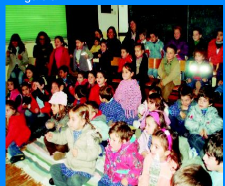
De olhos fixos no palco...