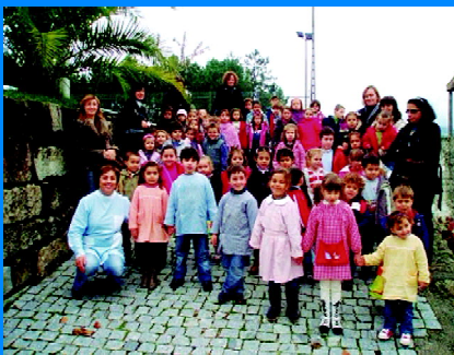
Chegada a Coucieiro...