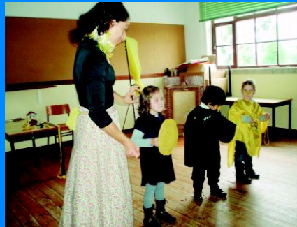
As personagens da história.