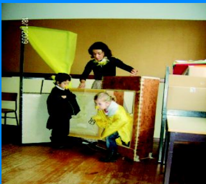
O melro conseguiu libertar a pomba...